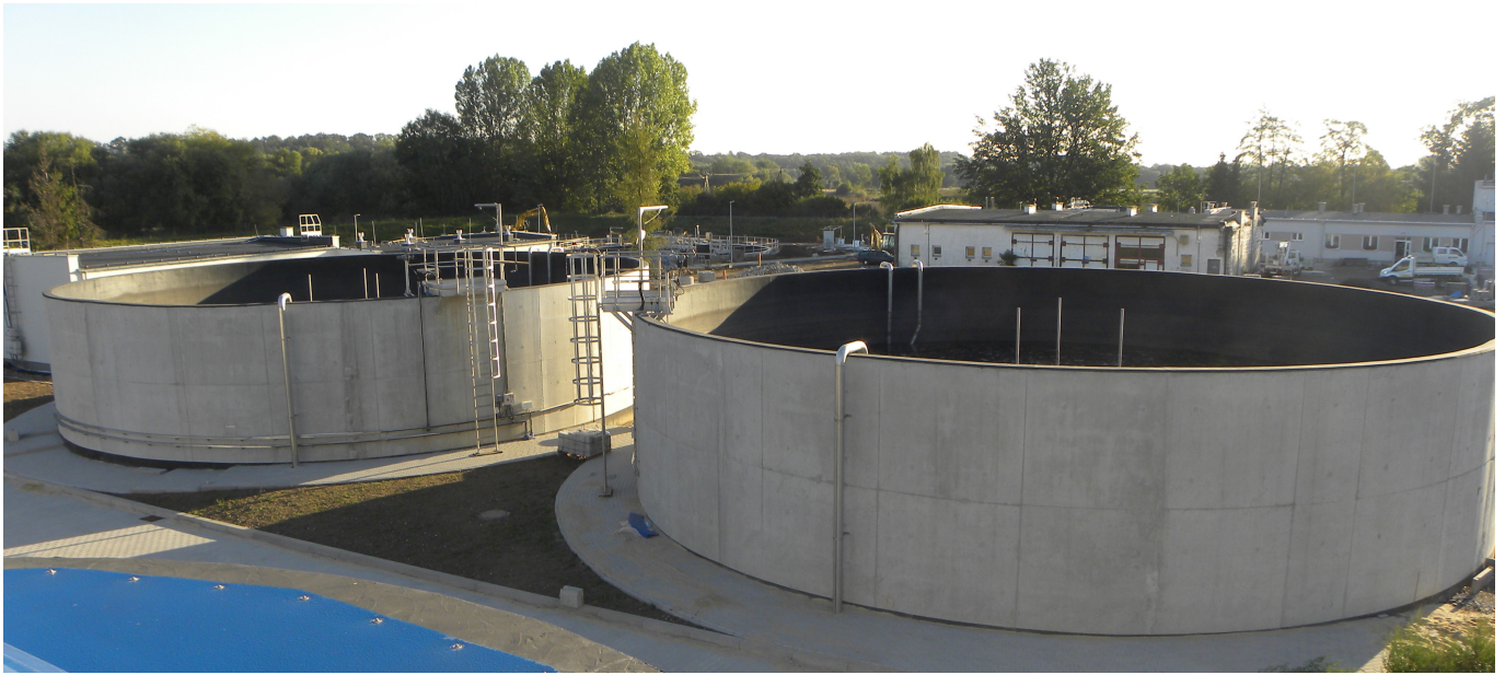
Komory tlenowej stabilizacji osadu