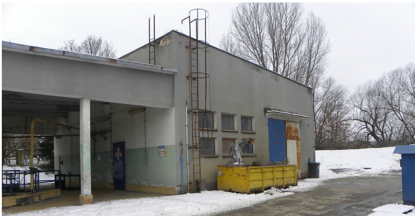
Budynek krat i piaskowników przed modernizacją