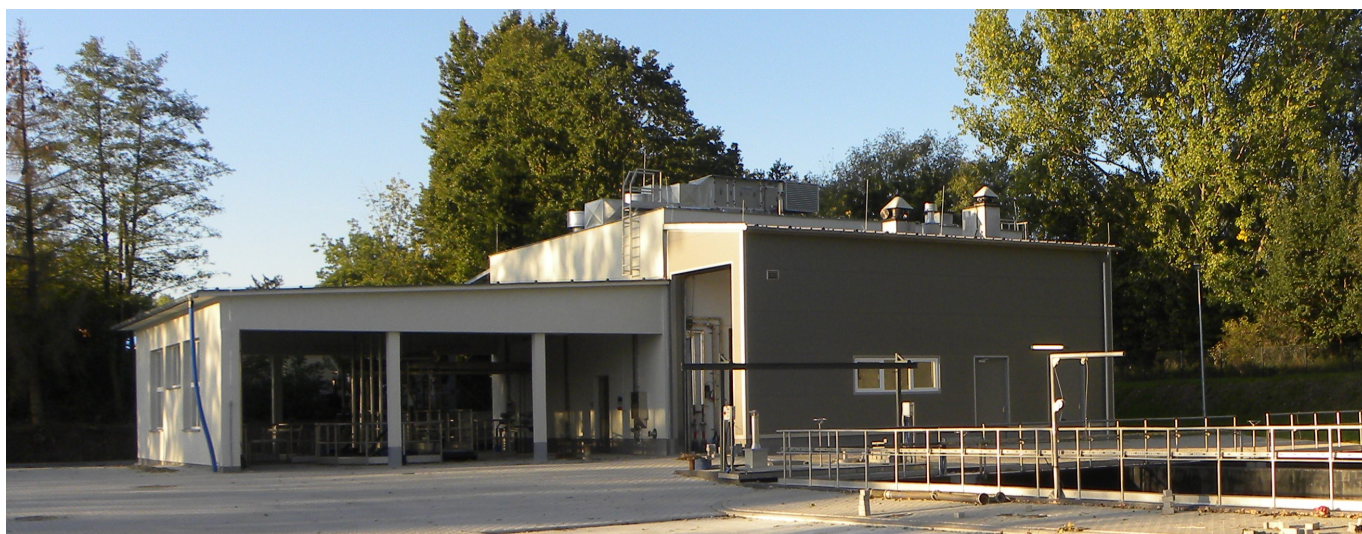
Budynek krat i piaskowników po modernizacji