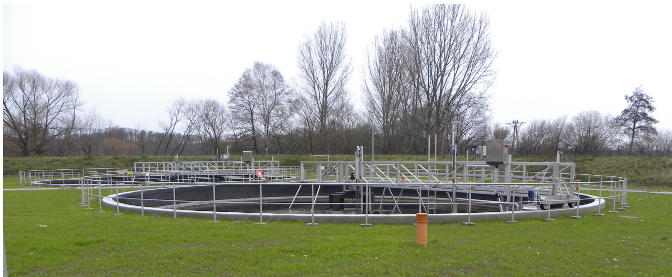
Osadniki wtórne po modernizacji