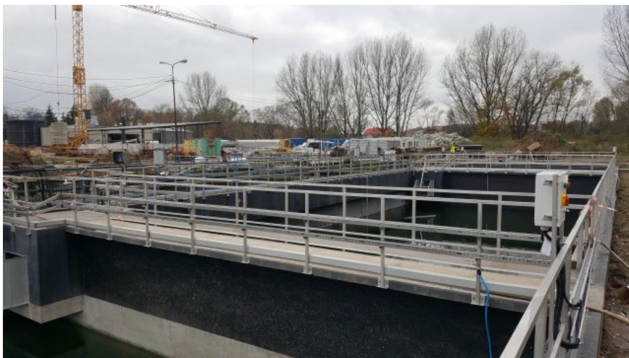
Komora tlenowej stabilizacji