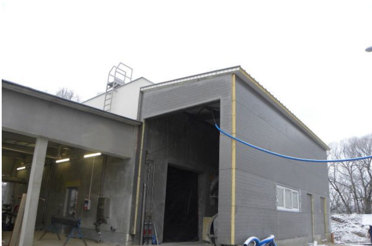
Budynek odwadniania osadów