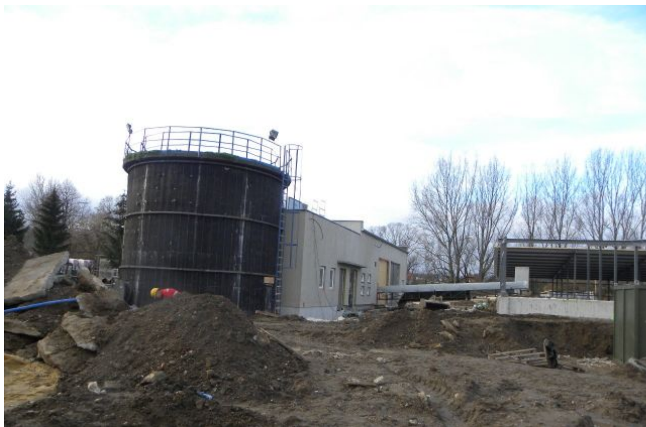
Place składowania osadu odwodnionego